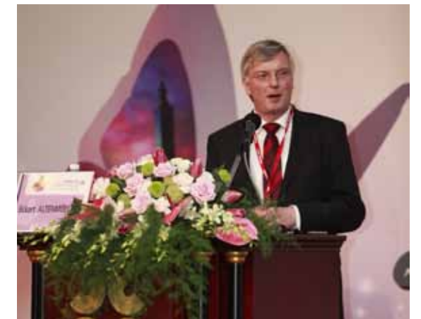
德國漢諾威音樂戲劇大學附設「音樂生理學暨音樂家醫學研究中心」主任 Altenmüller 專題演講：「巴金森症的神經音樂治療」。