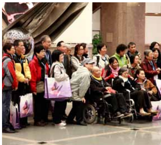
台灣的帕金森病友及家屬熱情參與。