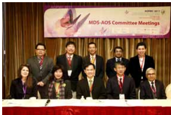
世界動作障礙學會亞太分會委員合影。

對抗帕金森是一條長遠的路，需要親朋好友的陪伴、醫療人員的照護，甚至病友團體間的互相勉勵。這次非常感謝「台灣動作障礙學會」所有的醫師、工作人員大力地協助舉辦，以及當日與會的所有病友、家屬熱情的參與，讓我們能有這麼寶貴的學習機會。