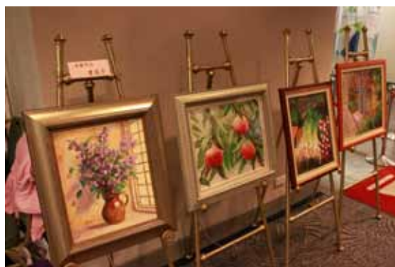
台灣病友展出的精彩畫作令人驚艷。