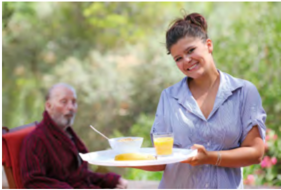
心情愉快的看護照顧病人時通常比較有耐心與愛心。

目」，病患家屬只要依法取得度身心障礙手冊的肢障證明，經長期照顧管理中心推介本國看護未成功者，便可直接申請外籍看護，也可免除每隔三年重新評估一次的限制，提高了巴金森患者申請外籍看護的方便性。